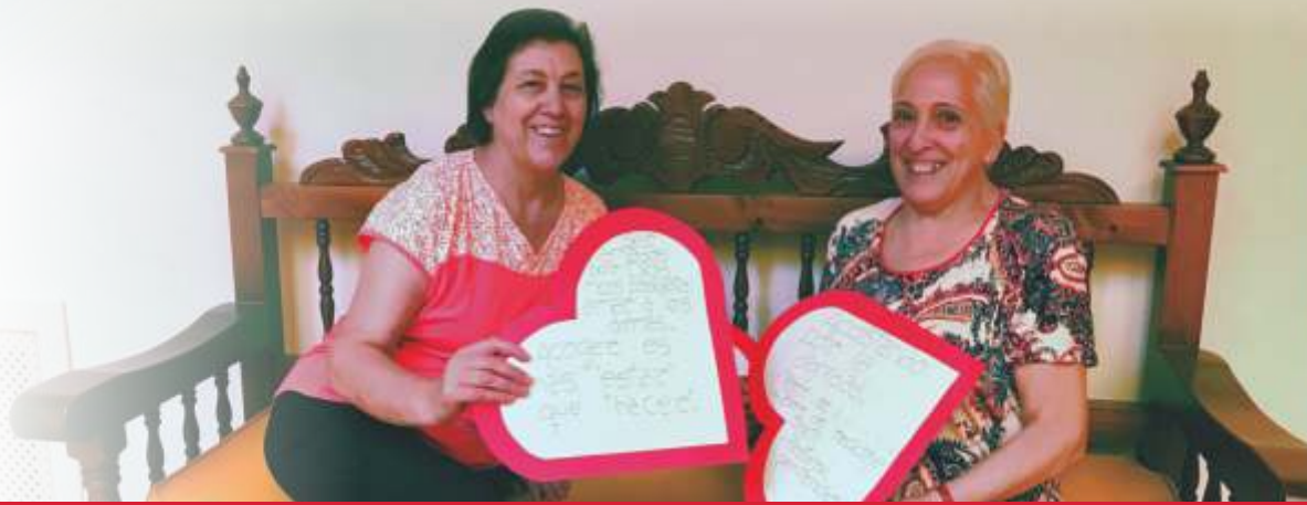
Voluntarias del Grupo de Acogida.

Voluntaria Grupo Acogida Caritas Interparroquial de La Solana