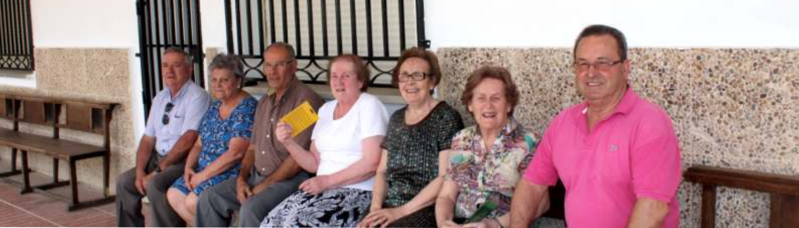
Voluntarios de Cáritas Interparroquial de Tomelloso.