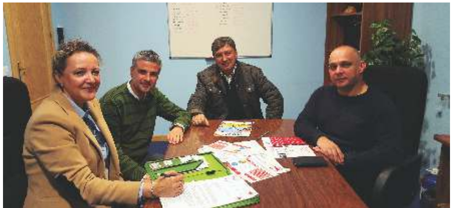
Aeda Firma del convenio de colaboración ECC.

situación social cada vez más justa e igualitaria” . Por ello, en la AEDA están especialmente sensibilizados con el programa de Empresas con Corazón en particular, así como con otros proyectos y labores que desempeña Cáritas. Desde que firmase convenio de colaboración, la asociación ha informado a los empresarios adscritos a la misma, del funcionamiento del programa. Animándoles a participar de forma individual, para sumar esfuerzos por el bien común de los más desfavorecidos. ■